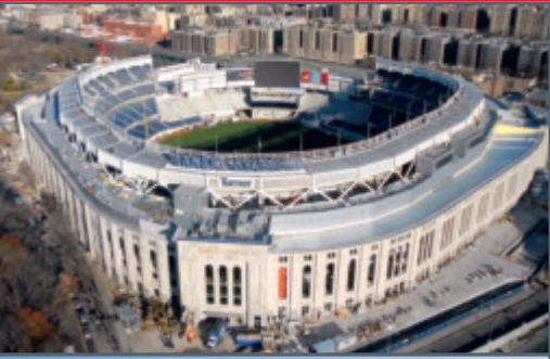
New Yankee Stadium, New York, NY