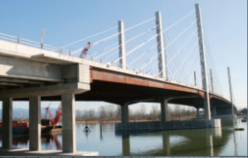
Pont Pitt River, Pitt Meadows, BC