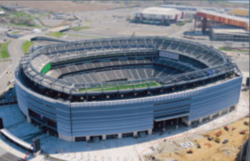
Meadowlands Stadium (Jets et Giants), East Rutherford, NJ