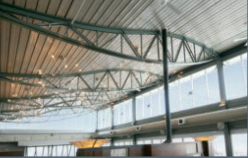
Haverstraw Marina, West Haverstraw, NY